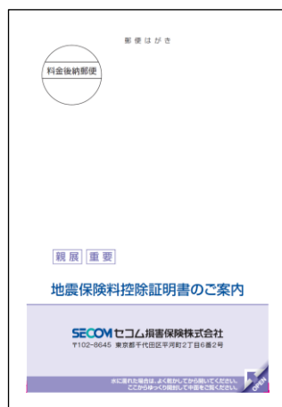
(満期戻総合保険用)