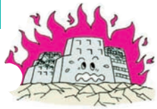
①地震で火災がおこり建物が焼けた