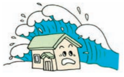
③津波により建物が流された

火災保険では、 ①地震等による火災(およびその延焼・拡大損害)によって生じた損害 ②火災(発生原因の如何を問いません)が地震等によって延焼・拡大したことにより生じた損害 はいずれも補償の対象となりません。 これらの損害を補償するためには、地震保険が必要です。