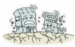
②地震で建物が倒壊した